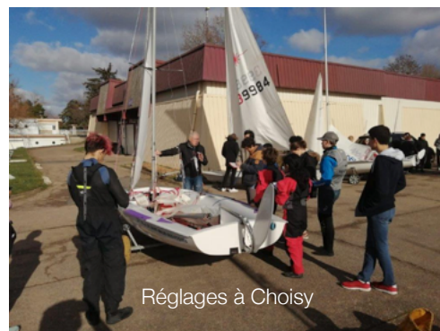
Réglages à Choisy

Le CdV 94 fait un effort, pour former de nouveaux équipages et organise un entraînement chaque samedi au club de Choisy. En prévision du stage, la ligue a participé à celui du 4 février, pour vérifier les bateaux et rappeler les fondamentaux de réglages statiques à terre et dynamiques sur l'eau.