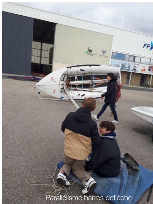
Parallélisme barres de flèche

Merci aux parents pour leur implication efficace dans la logistique et leur sympathie à notre égard.