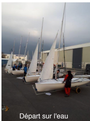
Départ sur l'eau

Les commentaires des coureurs 5 jours - le stage a commencé dimanche par un tour des bateaux et les indispensables tables de réglages de mât, vérifications des taquets, etc.... . Puis stage à Brest du lundi au vendredi. Le stage se terminera par une régata à Port-Blanc samedi et dimanche.